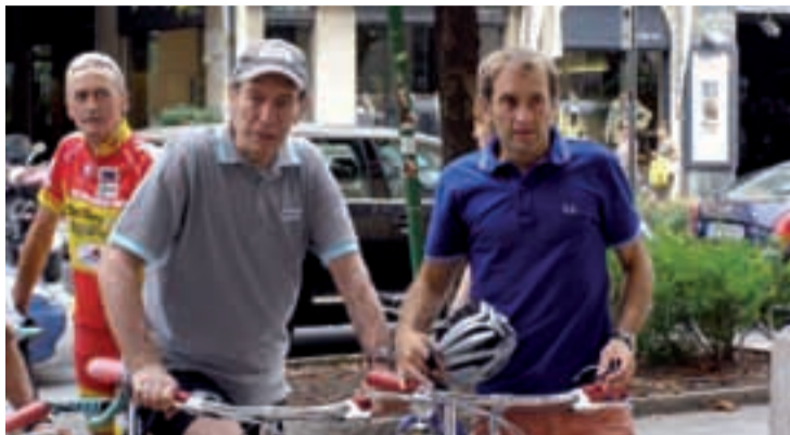
Felice Gimondi oggi in compagnia di un altro campione, Ivan Gotti (destra).

ta è diventato esasperato. Troppo. Vincere significa oggi essere sempre al massimo della condizione. Non è possibile. Ho letto proprio recentemente (l'intervista al grande Felice ci è stata concessa qualche giorno prima della conclusione del 2006) che gli attuali leader percorrono in allenamento qualcosa come 150 km. Noi adottavamo un altro sistema, si cominciava piano con 50-60 km per accentuare la preparazione in vista della ripresa ufficiale dell'attività, un modo diverso di allenamento che consentiva comunque di rimanere in discreta condizione per l'intera stagione. Noi si iniziava dalla Milano-Sanremo quindi avanti con le grandi tre corse a tap-