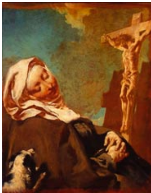
Santa Margherita da Cortona (1247-1297)