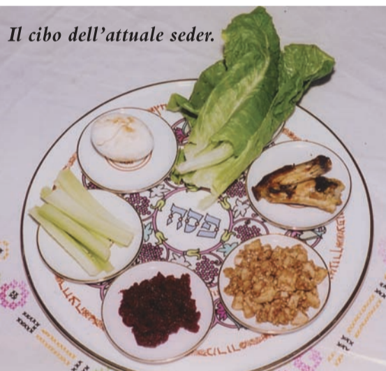
Il cibo dell'attuale seder.

Sicché, l'ultima cena di Gesù con i suoi discepoli è la cena che gli ebrei preparano per ricordare la fuga dall'Egitto e, invece, per noi cattolici